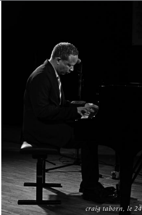
craig taborn, le 24

FREQUENTATION ET REPARTITION PUBLIC A. Soirées payantes Sud des Alpes... 2014 - 64 soirées payantes Sud des Alpes. 3981 spectateurs. fréquentation moyenne, 62 spectateurs par soirée.