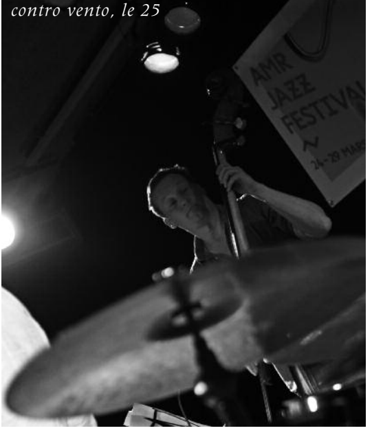
contro vento, le 25

LES ATELIERS Pour l'année 2014-2015 nous avons 274 inscrits dont 114 nouveaux (contre 284 et 114 l'an dernier).