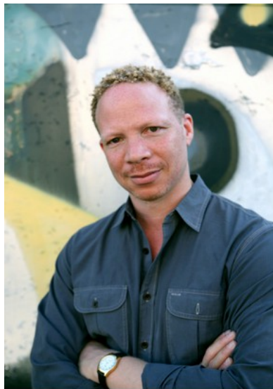
Craig Taborn