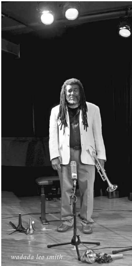
wadada leo smith