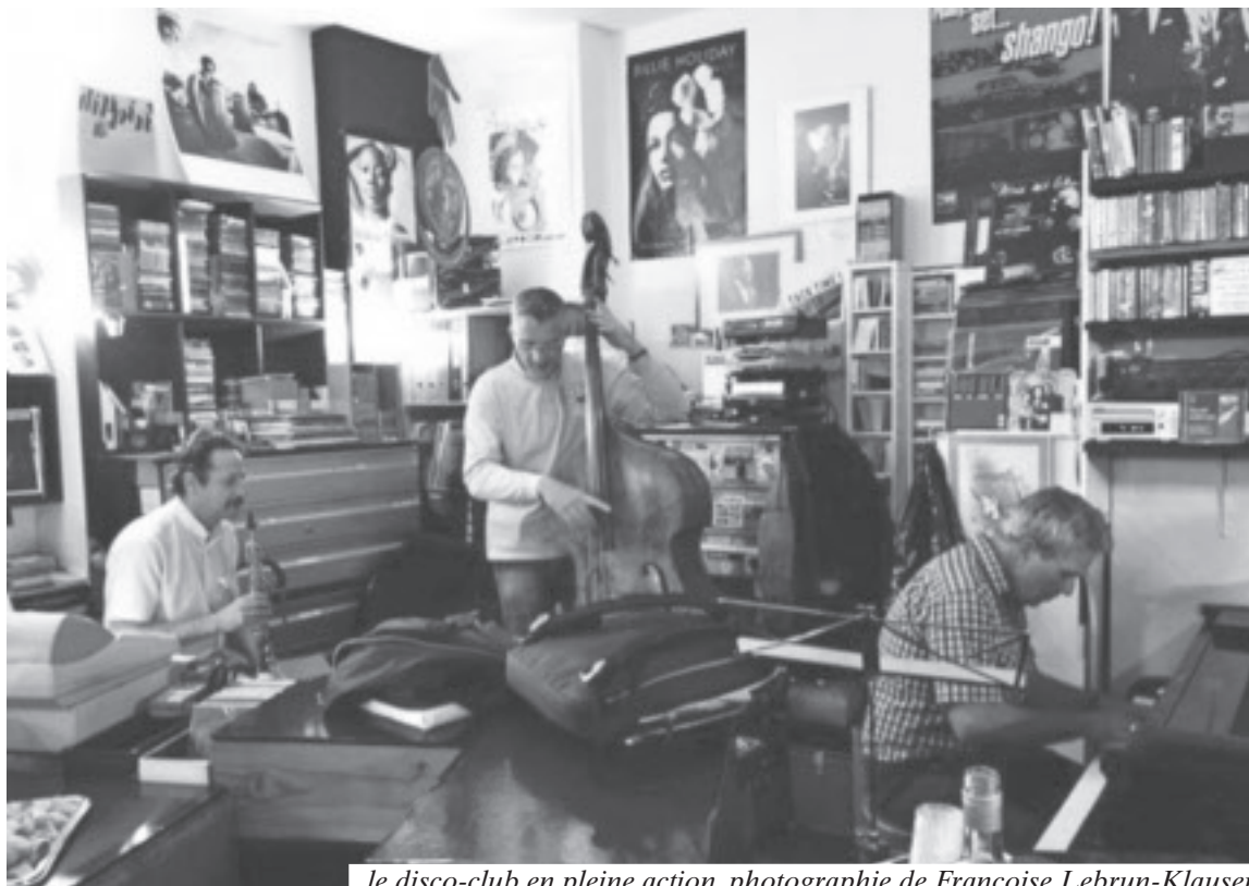
le disco-club en pleine action