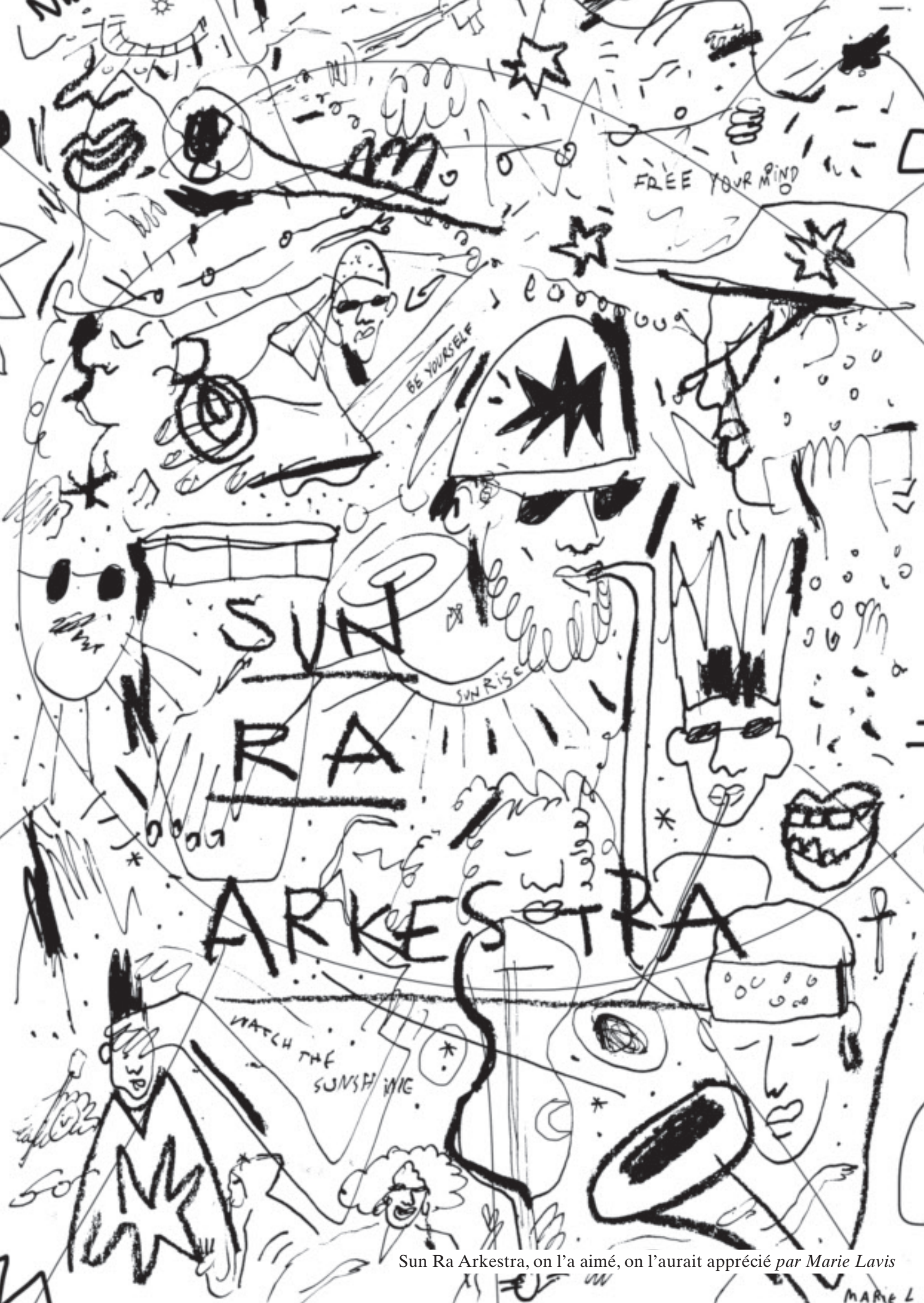
Sun Ra Arkestra, on l'a aimé, on l'aurait apprécié par Marie Lavis